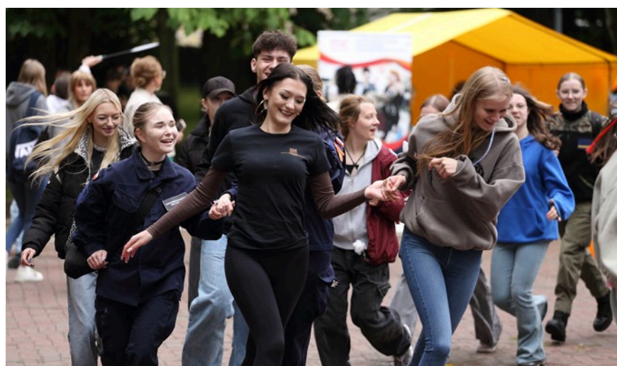
Zabawa podczas pikniku w Parku Miejskim w Kielcach.

Prezes Zarządu ZDZ w Kielcach w-ce przew. Krajowej Rady ZDZ