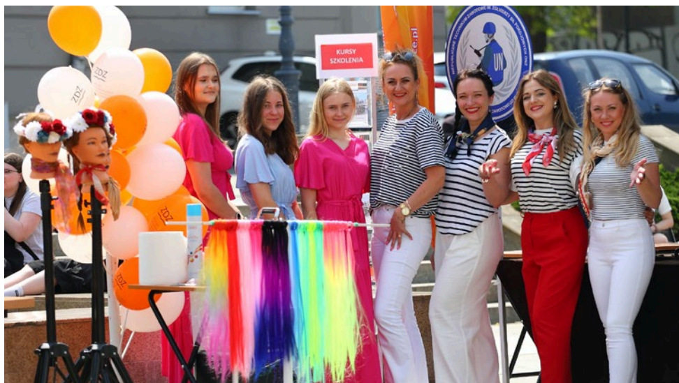
Francuski styl, francuski szyk.