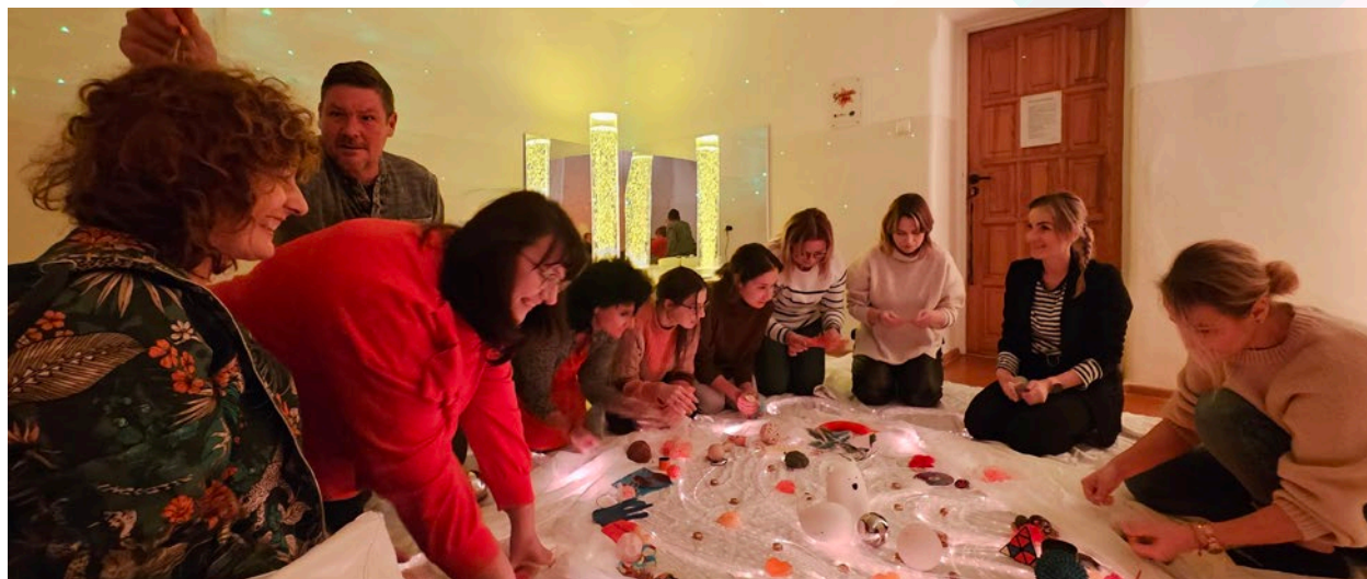
Koncepcja Snoezelen, czyli metoda terapeutyczna redukująca stres i lęk. Kurs prowadzony przez międzynarodowych specjalistów.