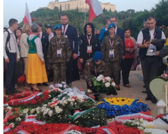
Monte Cassino. Młodzież ze Szkół ZDZ w Ostrowcu Św.

Dyr Pustuła zapewniła zaproszonych gości, że przekazanie pamiątek będzie miało odświętny, uroczysty charakter.