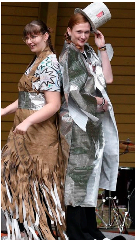
Pokaz mody EKO.