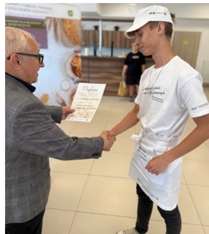
Finał ogólnopolskiego konkursu.

Oliwier nie tylko piecze, wygrywa konkursy i pięknie opowiada, ale także wędkuje i zajmuje go auto detailing.