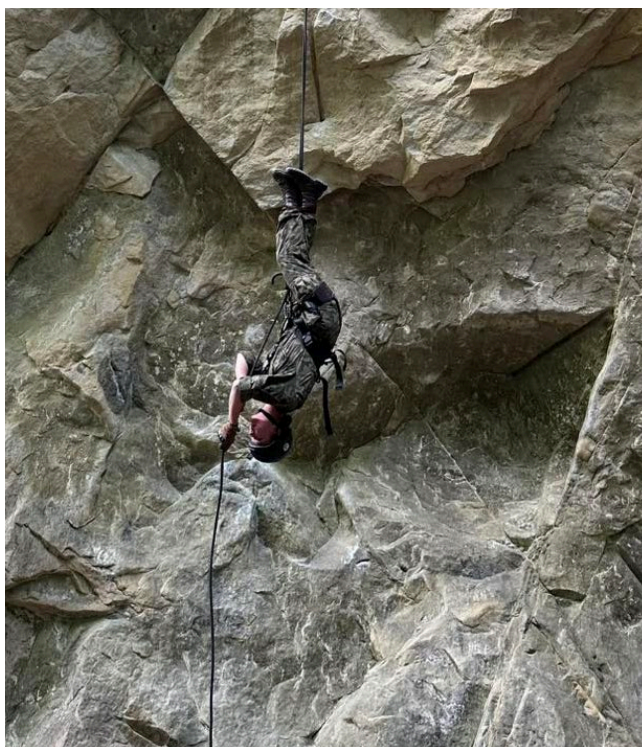
Zjazd głową w dół.

Uczniowie Technikum im. Wojska Polskiego w Starachowicach ZDZ w Kielcach, sami zwrócili się do dyirekcji z prośbą o możliwość wzięcia udziału w szkoleniu technik linowych . Kurs zorganizowany w miejscowości Zwierzyń w Bieszczadach przygotowuje do poruszania się w trudnym terenie, na wysokości, z wykorzystaniem lin i specjalistycznego sprzętu.