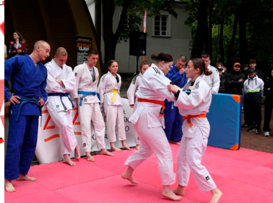
Duże zainteresowanie wzbudził pokaz judo.