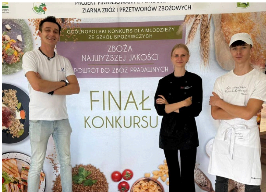
Uczniowie ze swoim mistrzem.