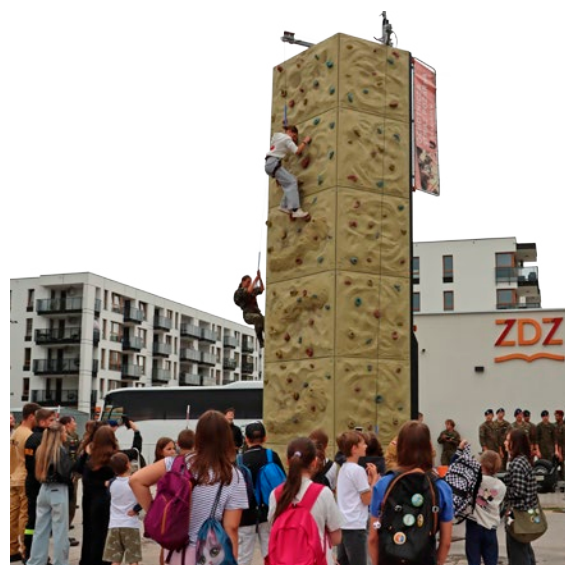
Zabawa wokół ścianki wspinaczkowej.