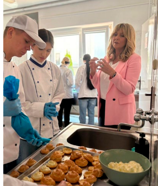
Warsztaty pod czujnym okiem mistrzyni Ewy Wachowicz.

Spotkanie miało również wymiar motywacyjny. Ewa Wachowicz podzieliła się z młodzieżą wspomnieniami ze swojej drogi zawodowej, opowiadała o kulisach pracy w mediach, o pasji, która stała się jej sposobem na życie, oraz o wartościach, które przyświecają jej w codziennej pracy. Uczniowie zadawali pytania, prosili o rady i dzielili się swoimi kulinarnymi marzeniami.