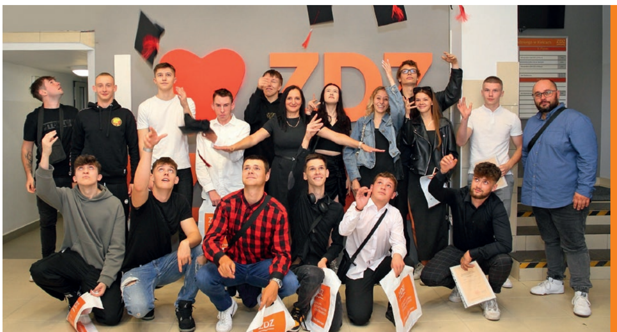
Pożegnanie, którego się nie zapomina.