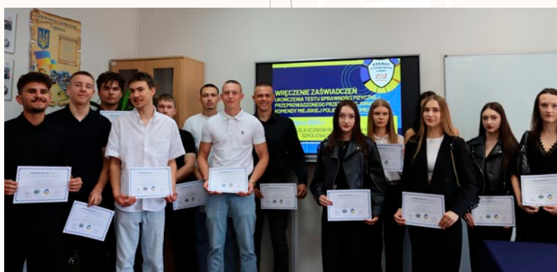
Test sprawności fizycznej za nimi...

W lipcu, grupa tegorocznych absolwentów z klas realizujących program szkolenia o profilu mundurowym, ode-