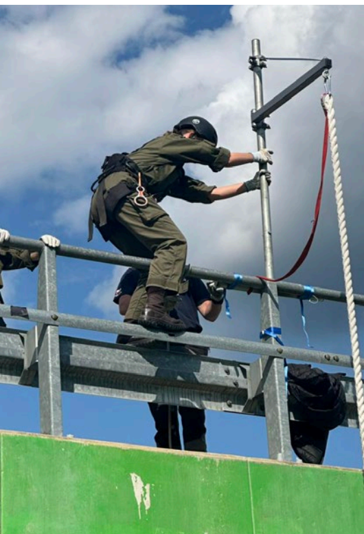
Wejście na linę desantową. Symulacja śmigłowca zawieszono w niskiej pozycji nad ziemią.

brała zaświadczenia o ukończeniu Testu sprawności fizycznej. Ten ważny sprawdzian był prowadzony przez funkcjonariuszy Komendy Miejskiej Policji w Radomiu. Stąd zaświadczenie jest sygnowane nazwiskiem Komendanta Miejskiego Policji mł. insp. Roberta Janika. Dokument zaś procentuje przy staraniu się o przyjęcie na kierunki mundurowe wyższych uczelni bądź przy aplikowaniu o podjęcie pracy w służbach mundurowych, w szczególności w policji oraz straży granicznej.