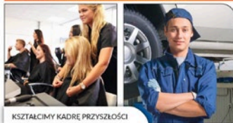
KSZTAŁCIMY KADRE PRZYSZŁOŚCI

Nie czekaj - zapisz się już dziś! Zapisy online: szkoly.zdz.kielce.pl