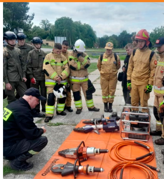
Zajęcia z edukacji strażackiej.

Kolejny obóz szkoleniowy, tym razem o charakterze wojskowo-pożarniczym, odbył się w czerwcu w Centrum Szkolenia Logistyki w Grupie koło Grudziądza. Tym razem 42. uczniów klas mundurowych brało udział w zajęciach dotyczących edukacji wojskowej i strażackiej. Obóz był również okazją do upowszechniania znaczenia aktywnego wyczynku. Wiele zajęć podczas obozów organizowanych przez ZDZ w Kielcach koncentruje się bowiem na poprawie kondycji fizycznej, która jest nieodzowna w pracy w służbach mundurowych.